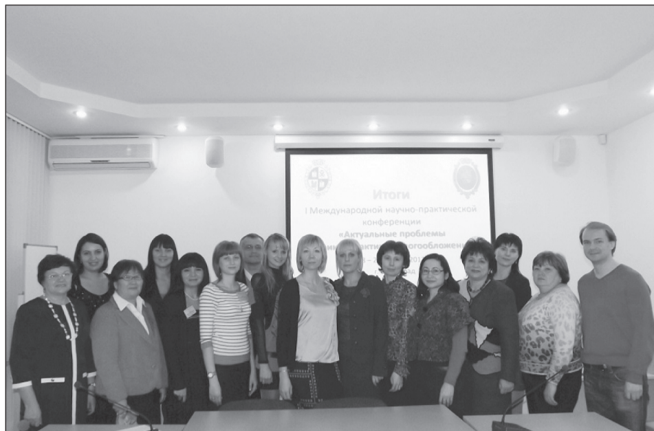
Участники I Международной научно-практической конференции «Актуальные проблемы теории и практики налогообложения»