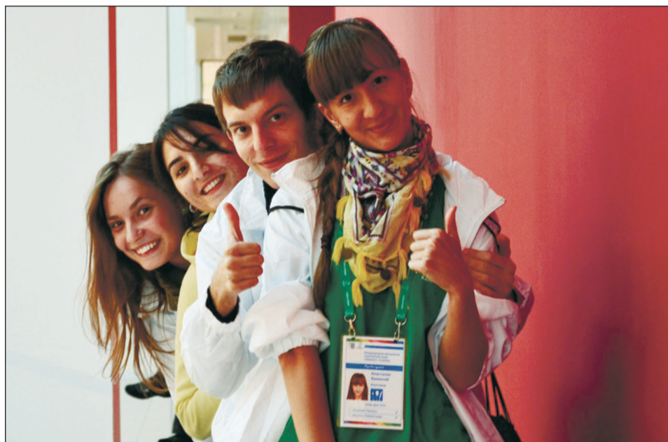
... и каждого! Если ты еще не с нами – присоединяйся!