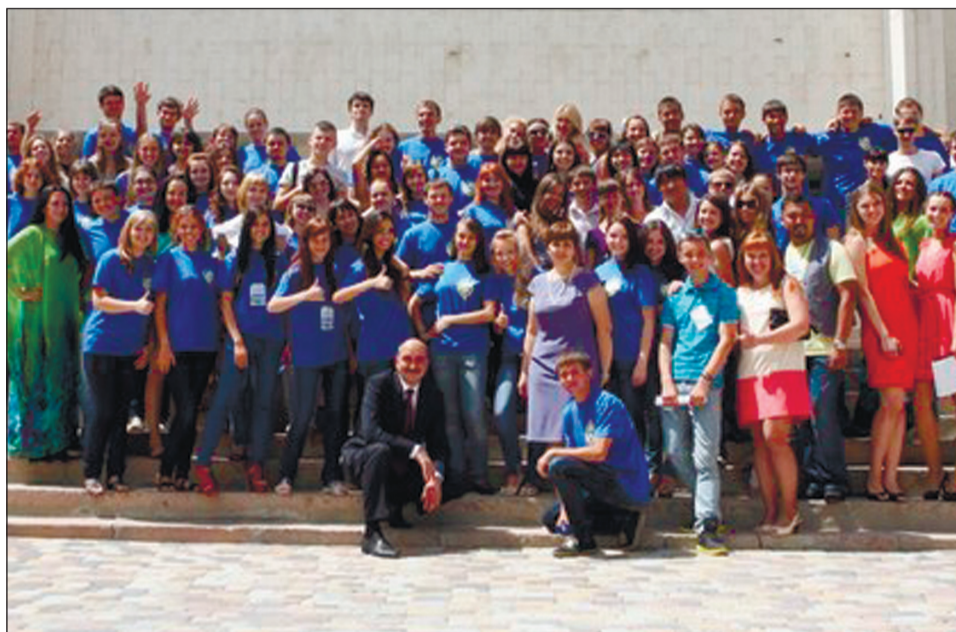
«Формула роста» – это проект всех...